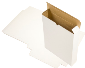
FEFCO 0211 - Arkiveske