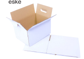
FEFCO 0711 -Hurtigbunn eske