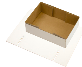
FEFCO 0452 - Brett

For mer informasjon, kontakt oss på telefon 31 30 19 00