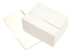
FEFCO 0202- Sjakteleske med overlappende fliker

For mer informasjon, kontakt oss på telefon 31 30 19 00