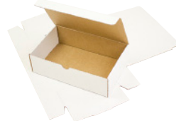
FEFCO 0421 - Selvlåsende eske med lokk