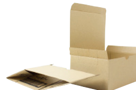
FEFCO 0713 - Stanset eske med brettebunn og lokk