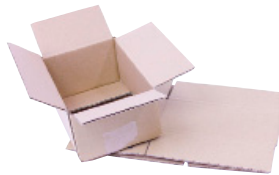
FEFCO 0201 - Sjakteleske