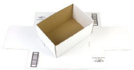
FEFCO 0422 - Selvlåsende brett