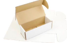
FEFCO 0471 - Selvlåsende eske med klaffer