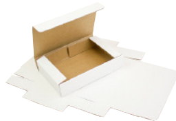
FEFCO 0426 - Selvlåsende eske