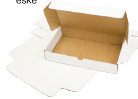
FEFCO 0429 - Selvlåsende eske

For mer informasjon, kontakt oss på telefon 31 30 19 00