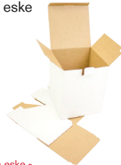
FEFCO 0215 - Konvoluttbunn eske