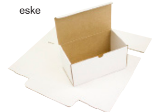
FEFCO 0470 - Selvlåsende eske

For mer informasjon, kontakt oss på telefon 31 30 19 00