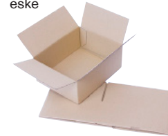
FEFCO 0701 - Hurtigbunn eske