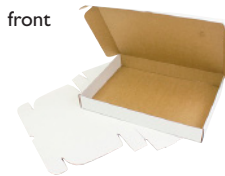
FEFCO 0427 - Selvlåsende eske med lokk som låses i front